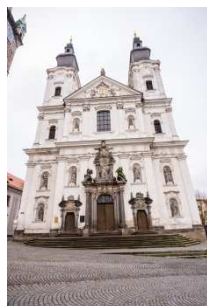
Kostel Neposkvrněného početí Panny Marie a sv. Ignáce

Pojmenuj památky na fotografiích, na mapě města vyznač následující památky a nejlepší vycházku městem.