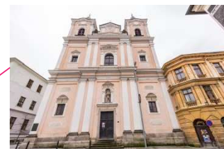
Kostel sv. Vavřince