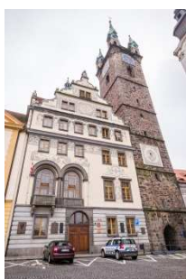
Radnice a Černá věž