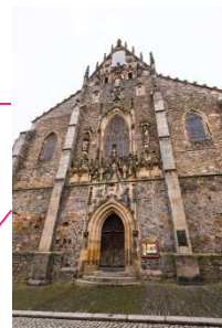
Kostel Narození Panny Marie