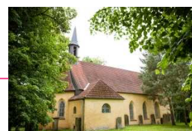
kostel sv. Václava