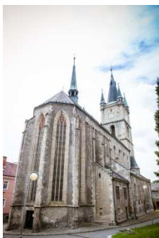
kostel Nanebevzetí Panny Marie